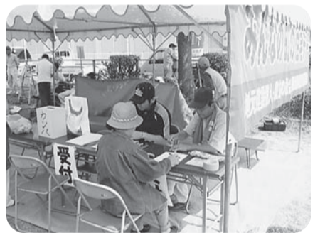
【松原分会】 中友公園で開催 組合員と家族11人 住民24人参加 包丁41本、まな板11枚 その他1本 住宅相談1件(玄関のひさし)