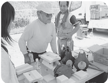
【勝立分会】 勝立団地第2公園で開催 組合員と家族12人 住民11人参加 包丁33本、まな板11枚 その他2本 住宅相談3件(洗面所リフォーム、 火災報知機、屋根瓦補修) 木で敷物やいす、木槌、まな板を作成して展示・販売