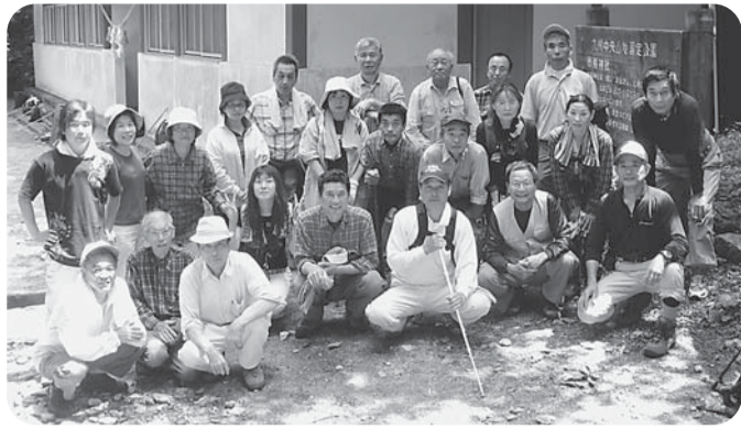
市房神社の前にて記念撮影

約1時間ほど登ると、市房神社があり、休憩をとったあとは、さらに頂上をめざしました。道のりは急斜面も多く、ロープをたどって登らないといかない場所もあり、なかなか登りごたえがありません。何度か休憩をとりながらなんとか頂上にたどり着いたのが14時過ぎでした。頂上での弁当は空気がおいしくおなかも減っているため最高の昼食でした。 残念ながら麓の景色は少しかすんで見えましたが、登っていると山々が見下ろせる風景は最高です。下山したあとは近くの温泉につかり、その日の疲れを癒しました。