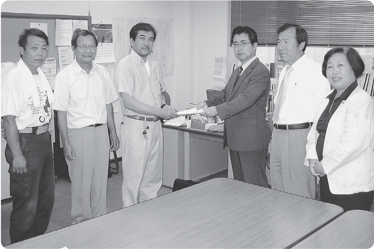
公契約条例の制定を国に求める意見書を共産党市議団へ請願

福岡県建設労働組合 大牟田支部 〒836-0044 大牟田市古町3-2 TEL(53)1533 FAX(54)6830 発行・編集者 永松健児