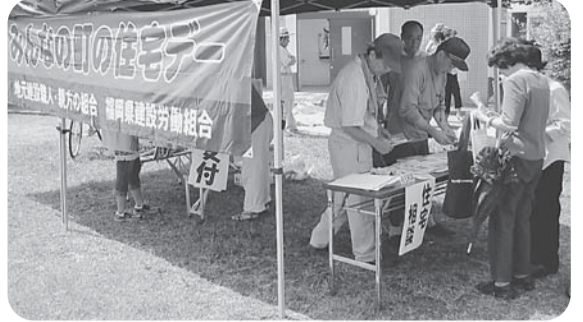
【白光分会】 明治公園で開催 組合員と家族6人、住民16人参加 包丁29本、まな板5枚 住宅相談ない