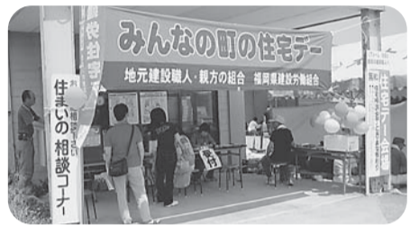
【田隈分会】 徳永産業で開催 組合員と家族17人 住民40人参加 包丁38本、まな板3枚 住宅相談2件 (床貼替、リフォーム) 親子で楽しめるように金魚・ヨーヨーすくいを開催