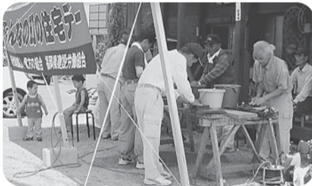
【甘木分会】 サカグチ住建前で開催 組合員と家族8人 住民4人参加 包丁30本、まな板4枚、 その他6本 住宅相談1件(流し台)