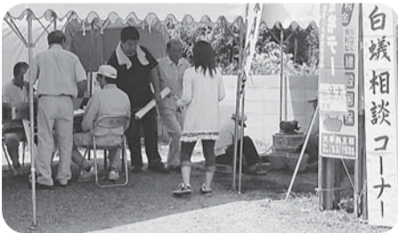
【歴木A分会】 前原分会長宅前で開催 組合員と家族8人、住民10人参加 包丁7本、まな板5枚 住宅相談3件 (瓦塗装、雨漏り、床の張替)