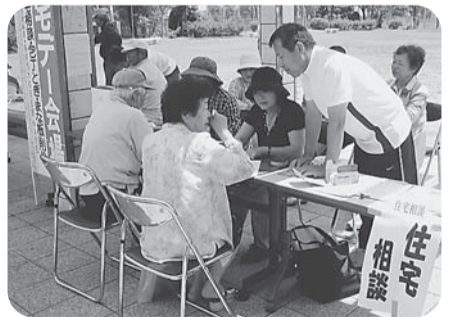
【船津分会】 船津公園で開催 組合員と家族18人、住民24人参加 包丁37本、まな板11枚 住宅相談3件