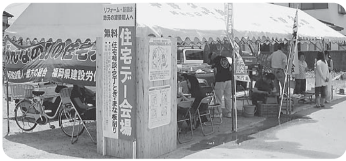
【歴木B分会】 セブンイレブン平の山店で開催 組合員と家族11人、住民15人参加 包丁39本、まな板9枚 住宅相談4件(火災報知機、瓦、サッシ、その他)

へちま、キュウリなどのほか、ゴーヤが最近の人気です。つたをからませる植物のネットは、ホームセンターなどで購入できます。