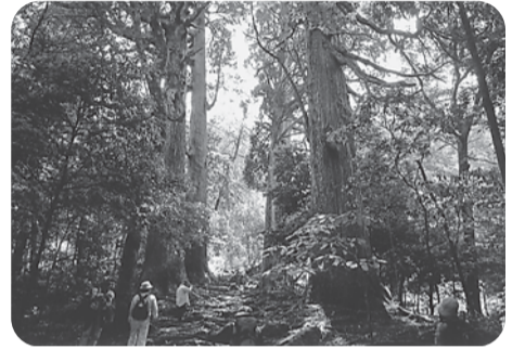
市房山の大自然(1000年杉)

山を開始しました。登山道に入り、すぐに樹齢1000年といわれる幹回りが8メートル以上もある見事な巨木が出迎えてくれました。