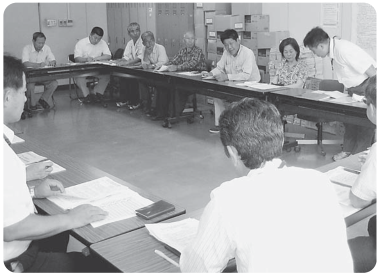
最低価格以下で落札できる調査制度廃止も求めた