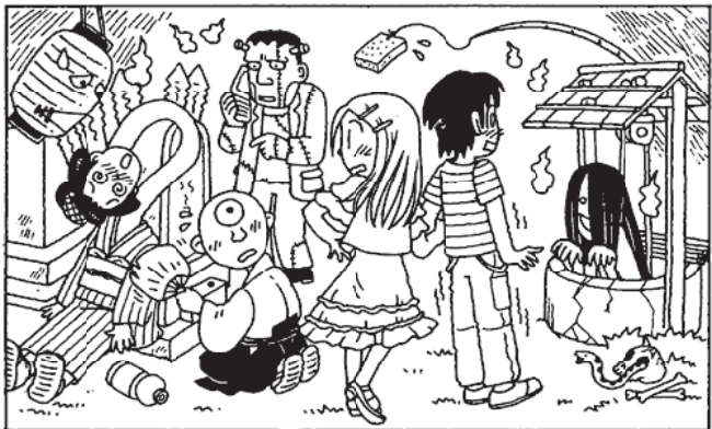
【問題】上の絵と下の絵では7つのまちがいがあります！どこでしょう？(作・野上和彦)