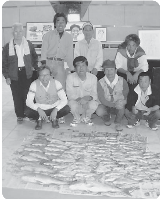
全体で60枚の大漁でした

事務所に戻っての検量では、どの参加者もクレーン一杯の大漁でした。 釣果や鯛釣り状況は船頭さんのホームページ(釣船・筑後屋)で見ることが出来ます。