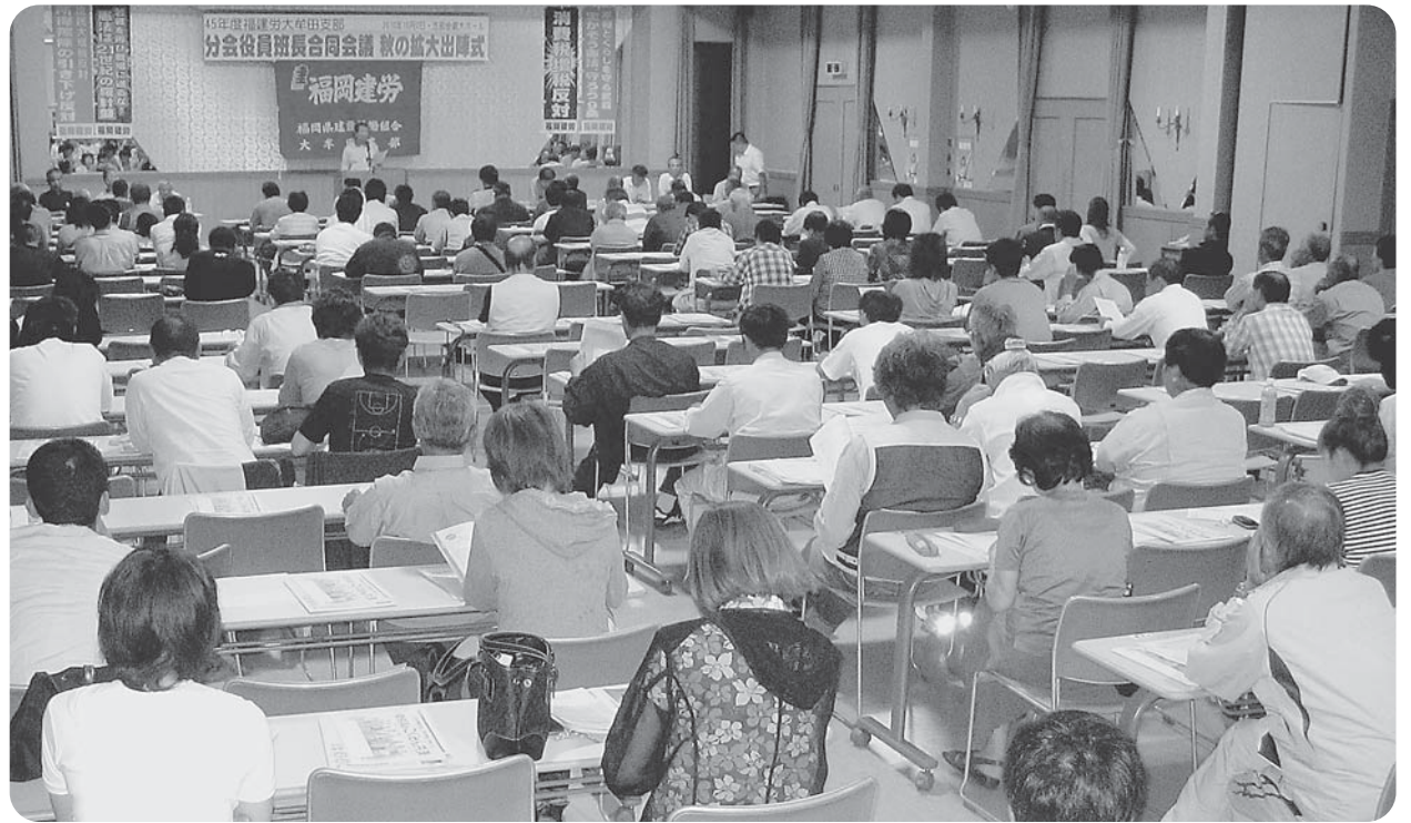
新年度の分会役員班長さん134人参加の合同学習会議

10月14日から秋の拡大月間に突入しています。今秋の大牟田支部の拡大目標は40人、なんとこの目標を達成させなければなりません。10月4日に分会役員班長さん134人が参加して合同学習会議を開催して、1年間の組合運動の前進のために奮闘していくこととの意思の統一と合わせ、拡大月間の出陣式を行い目標達成のためこの1年