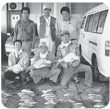
鯛だけで70枚以上の大漁

今年の大鯛釣り大会は9月22日に天草の鬼池に分乗し事務所を出発。車中では思い思いに我こそ一番の釣り頭にとの釣り談義。 夜明け前の5時半に2艘の船に分乗し釣り場まで30分です。 ポイントで船を流しながらの釣りは、朝一から良型がぼんぼんときまりましたが、良潮が流れ始めてからは淡々と小型ばかり。それでも真鯛の2.8kgをはじめ、かさご、ぐち、かます、ふぐ、サメなどの釣果に一喜一憂です。 釣果や鯛釣り状況は船頭さんのホームページ(釣船・筑後屋)で見ることが出来ます。