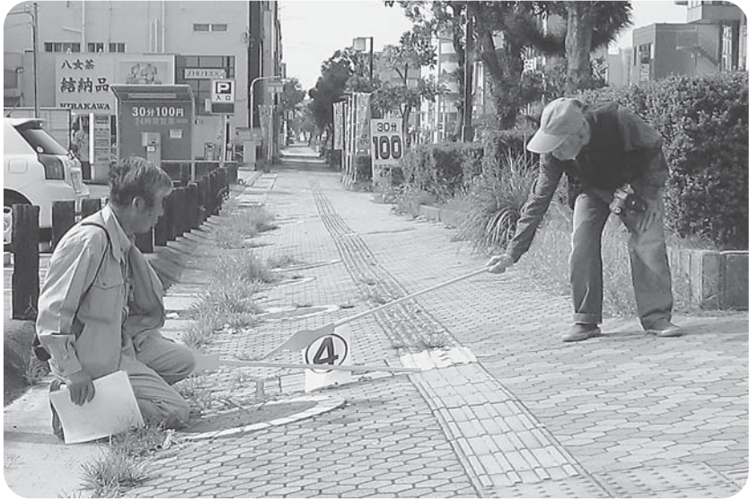
「歩道の傾斜がひどく、通行に危険」と申入れ後、歩道の大規模な改修工事へとつながりました。

街角ウォッチングは09年秋に大牟田4カ所で実施し、市や県に申し入れ後、工事につながったりと、大きな成果をあげました。 今年も大牟田市市内4カ所で実施します。ぜひ、近所の方はいっしょに仕事おこしの行動に参加ください。 集合場所や時間などは組合事務所まで。 玉川校区 10月15日(土) 白川校区 10月22日(土) 倉永校区 10月27日(土) 三川地域 未定