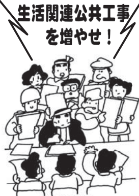
生活関連公共工事を増やせ！ 請願署名を提出

生活関連型公共工事 予算が減らされ、積算単価も低く、末端で働く私たちは、営業できない工事単価、生活で