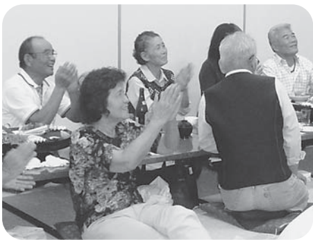
宴会では大盛り上がり

【鳥巢喜治・橘分会】 「先輩たちを敬う会(敬老会)」を9月22日に大牟田温泉で開催しました。組合員70才以上が16名、4役が7名と書記1名の24名の参加。 温泉に入り、午後6時から行われました。シニアの人々はまだまだ元気いっぱい!お