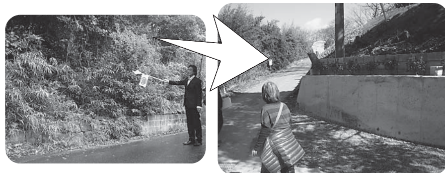
カーブになっているところで木が生い茂り見通しが悪い。通学路でもあり危険なので改善を要請。伐採後土手もきれいに整備され道幅も広くなり見通しもよくなりました。

対市交渉では、市当局より昨年11月に各校区の調査に基づいて改善の要望を行った内容について、その後の改善点や改善予定の