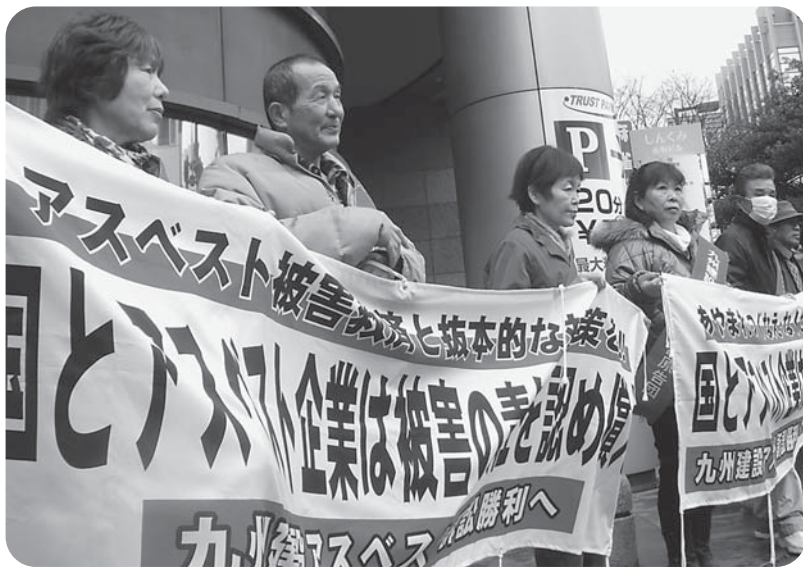
赤坂交差点前で宣伝行動