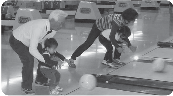
お孫さんと一緒にボーリング