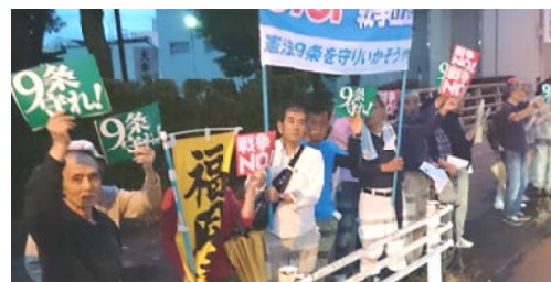
9・16集会後のアピール行動

8月29日5時半より、大牟田市築町公園にて100万人全国大行動の一環として「戦争法案の廃案を求めらるおむた市民集会」が小雨が降るしきる中開催され、450人の市民が参加しました。スピーカーとして戦争体験者など8人の人が法案反対の訴えをおこない、「絶対廃案して平和な日本を守ろう!」との集会アピールを採択し、大牟田ゆめタウンまでパレードをおこないました。