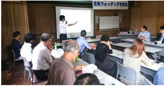
大牟田市役所から大牟田市の現状報告

同じ世代の様々な職種の間と交流する中で、独自の技術や考え方を話すことで新たな発見が得られる場面もあり、大いに盛り上がりました。今後とも青年部員を増やし、組織拡大