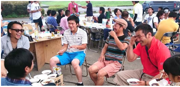
バーベキューで他支部の仲間と交流

同じ世代の様々な職種の間と交流する中で、独自の技術や考え方を話すことで新たな発見が得られる場面もあり、大いに盛り上がりました。今後とも青年部員を増やし、組織拡大