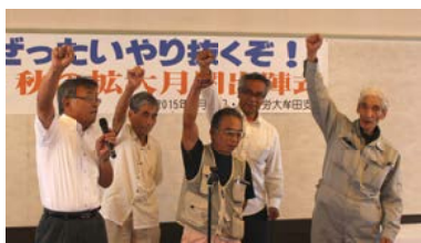
3人の目標やりきるぞー (船津分会)

9月13日定期大会後、場所を「だいふく」へ移し、秋の拡大出陣式と懇親会を開催しました。各分会から「連続拡大目標を達成して、組織を大きくしていこう」「ひとりでも多く