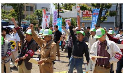
青空の中団結ガンバロー

5月1日、五月晴れの青空の中、大牟田市の築町公園で開催された大牟田地区統一メーデーに、『建設職人も8時間労働で生活出来る賃金と安心して暮らせる社会を』