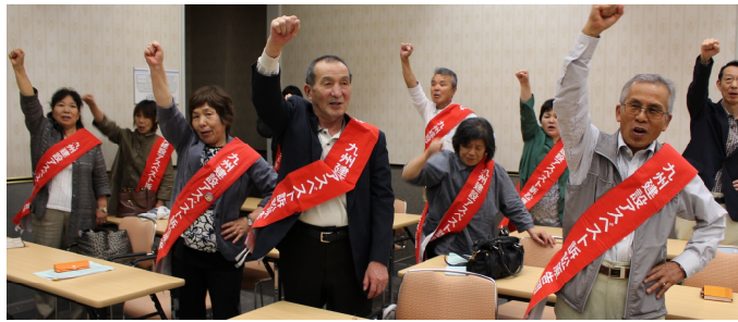
報告集会で勝利判決むけて団結

5月16日、九州建設 アスベスト訴訟3回目 期日が福岡高裁にて行 われ大牟田支部から原 告3人と13人で支援行 動に参加。 控訴審では2人の原 告の意見陳述と代理人 弁護士2人からこれま での東京、福岡、大阪 京都地裁での判決 でも明らかになよう に、労基法適用労 働者以外いわゆる 1人親方まで含め た国の責任につい て理論的に解明し、 企業についても、 責任建材と病因建 材の因果関係につ いて具体的に企業 の責任について揺 るがないものであ ると主張しました。 控訴審が終わった 報告集会が開催 され、熊本大地震