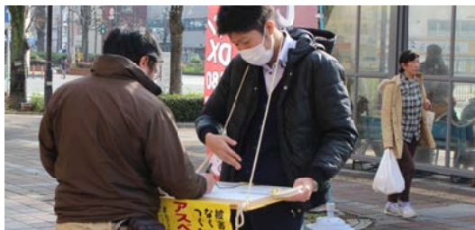
足を止めて説明を聞いてくれる方も