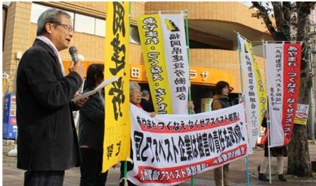
大牟田駅前にて旗を掲げる原告団

12月5日、お昼の12時から大牟田駅前にて、アスベスト街頭宣伝を遺族原告含め9名で実施しました。ハンドマイクでアスベスト問題が続いている事や基金 の設立をめざして闘っていることをうたえながら、チラシや署名への協力を呼びかけました。「国が管理してなかったとやけん、きちんと国が責任を認めんとでけん」と思うよー 「まだ、続いている問題やつたね。まわりにも伝えときます」 「がんばって、30分と短い時間でしたが、通行している一般の方からの声かけも。毎月 5日を街宣行動日として、12時から実施しています。1月は5日です。お昼休みの時間ですが、少しの時間でもいいのでみなさんの参加をお願いします。 12月19日は、建設アスベスト高裁の5回目期日でした。当日は、朝9時から大牟田駅前で行った支援行動に参加しました。今後は、第2陣提訴の準備も進めているところですよ。