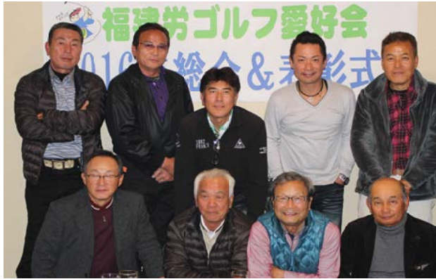
ゴルフ好きの仲間楽しんでます

12月10日(土)、荒尾分会の忘年会を荒尾のKATUMI(福建労の提携店・組合員が利用すれば特典あり)で開催し、18名の参加でした。分会長からは、拡大月間が終わわり、目標を達成したこと、報告と新年のみなさんの運動への参加協力がうたえられました。最期は全員で新年もがんばろーと団結しました。