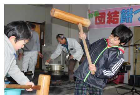
子供たちも頑張っていました

3月24日（金）早朝に大牟田支部管内の駅頭にて、電車通勤する一般の方に、私たちの賃金・単価の引上げをうったえる宣伝をおこないます。各分会で担当の駅をきめますので、多くの方の参加をお願いします。