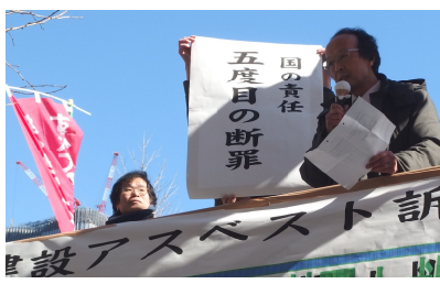
北海道での旗出し

全国6地域（北海道、札幌、関東、東京、横浜、関西、大阪、京都、九州、福岡）で建設アスベスト訴訟が行われています。 3月14日（火）、札幌地裁の判決が言い渡され、国を断罪する判決が下りました。