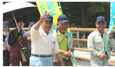
ゆめタウンまでデモ行進

者全員で、「働くものの団結で生活と権利を守り、平和と民主主義、中立の日本をめざそう」のスローガンと「佐賀空港の軍事基地化に反対する決議」を採択し、ゆめタウンまで国道沿いをデモ行進しました。