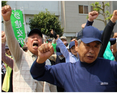
築町公園にがんばろうの声

また、建設アスベスト被害の全面救済を求めて闘っている遺族原告3人も参加し、集会の中でひき続きの支援と「建設アスベスト訴訟の公正判決を求める」署名への協力をうったえました。