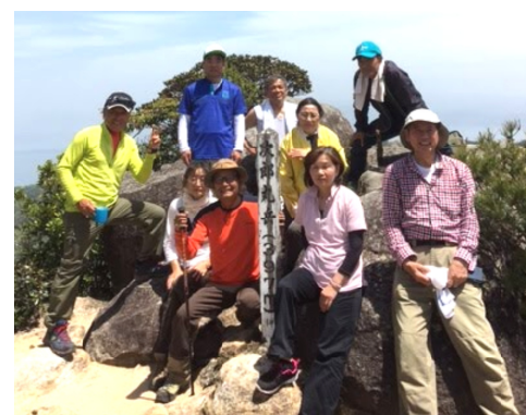
頂上は大パノラマがお出迎え

のは、弟嶽である次郎丸嶽に松島のキレイな夕陽を見せてあげると、移動したとき頂上が崩れて低くなつたという言い伝えがあります。