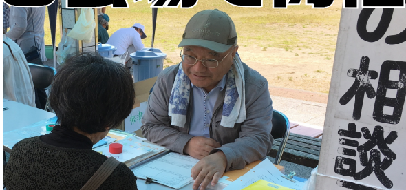
↑【船津分会】船津公園で開催。「近所に多くの職人さんがいることを知れて助かった」と石垣や手摺、塗装、雨漏等4件の住宅相談。