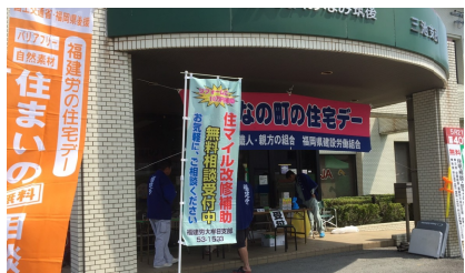
↑【田隈分会】JA三池支所で開催。雨戸・門柱の依頼、玄関、塗替えや大工工事・ふすまについて等3件の相談。