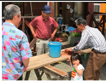
↑【甘木分会】サカグチ住建で開催。住宅の塗装を含めたメンテナンスなどの相談。