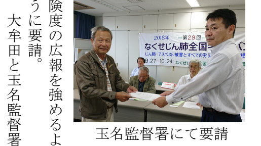
玉名監督署にて要請

ハザードマップの必要性うったえる キャラバンで市と署に要請 10月3日と4日にアスベストじん肺キャラバン大牟田荒尾玉名行動を実施。福建労、建交労、じん肺アスベスト訴訟弁護団から弁護士が参加しました。 大牟田市と荒尾市に要請