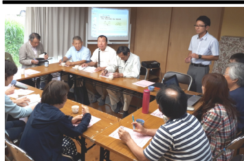
地元住民と集いを開催

(高取、沖田・神田、橋、三川・早米来地区)で集いの会を開催し、地元の住民の方より危険箇所や改善点を出しあいました。集いの中で出された内容をもとに現地へ確認し、大牟田市へ要望します。