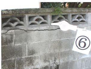
ブロック塀に亀裂