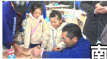
大人気の木工教室