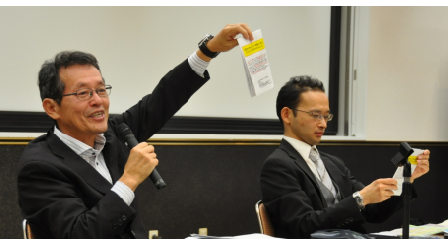
伊黒弁護士の説明