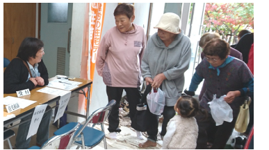
昨年の住宅デーの様子

松原分会の住宅デーは、地元の大正まつりと同時開催します。住宅相談会の他にもメダカすくいやくじ引きのお楽しみイベントもあります。また、ありあけ健康友の会の協力で健康チェックも行います。