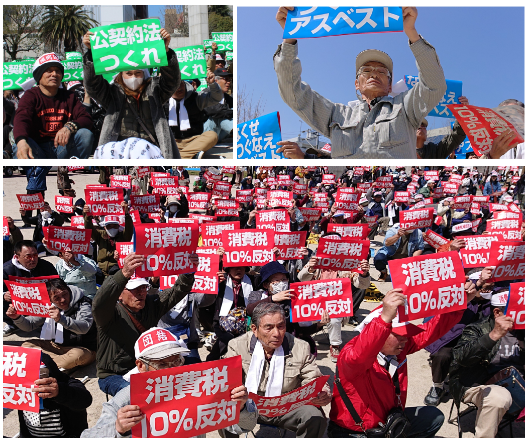
3大要求のプラカードをそれぞれ掲げて、要求声をあげました