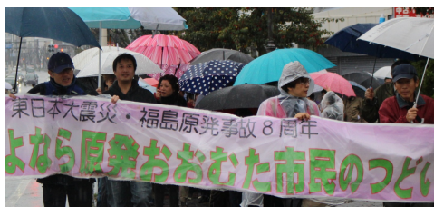
雨の中ゆめタウンまでパレード

この行動は、各分会の役員が中心に最寄りの駅頭で、出勤する労働者や消費者に理解を求め、公共工事の設計労務単価が7年連続で引上げられ、平成24年に比べれば、48%も上がっています。しかし、現場にはその引き上げが廻ってきていません。社会保険の完全適用と他産業の労働者と同じ賃金が確保され、若者が魅力ある建設業界新3K（給料の引上げ、希望が持てる業界へ、休日を実際にとれる）で現場が改善されるように今後も運動していきます。