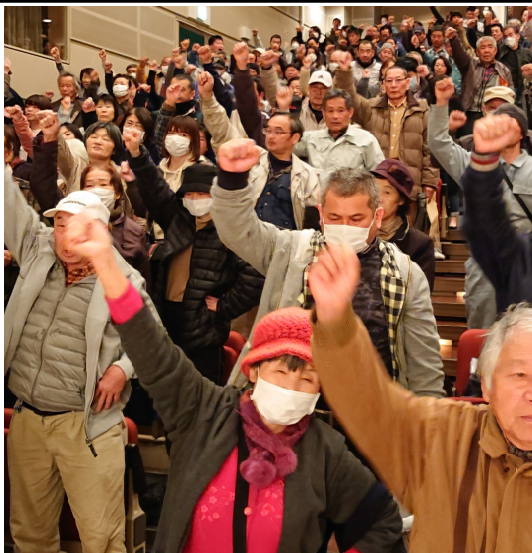
「消費税反対～」と声がる会場

たんできました」と組合員から労災や雇用保険、中建国保、確定申告、社会保険未加入問題の対策などの組合の情報を知りたいの加入がほとんどです。拡大月間も残りひと月、全分会での達成めざして毎週木曜日の統一行動日を中心に行動していきます。仕事確保、賃金引上げ、重税反対、社会保障充実など、私たちの要求はたくさんあります。