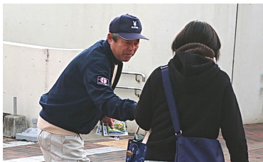
西鉄大牟田駅にて宣伝

「住まいと暮らしを守り、災害時に不可欠な建設職人が活躍するには賃上げが必要」と3月25日に全国で一斉に駅頭宣伝行動が行われました。早朝から大牟田支管内の10駅頭（JR大牟田、荒尾、銀水、吉野、渡瀬、瀬高、西鉄大牟田、新栄町、銀水、柳川）と南関町では、いきいき村にて実施し26人が参加。