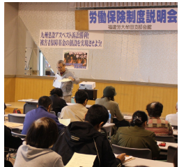
年度更新の説明も

労働保険の制度説明会を3月18日(月)に、労働保険適用事業所と一人親方。20日(水)に雇用保険適用事業所向けに開催し、全体で122人が参加しました。労働保険の目的や仕組み。労災の種類や