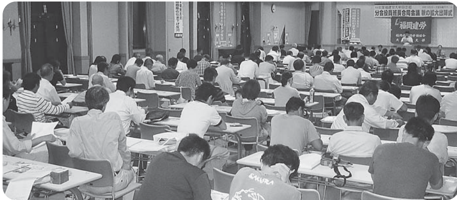
新年度の分会役員班長さん140人参加の合同会議

各分会でも4日、12日にかけて分会目標達成のための決起集会を開催して、勢をあげ、やりぬく決意を固めました。