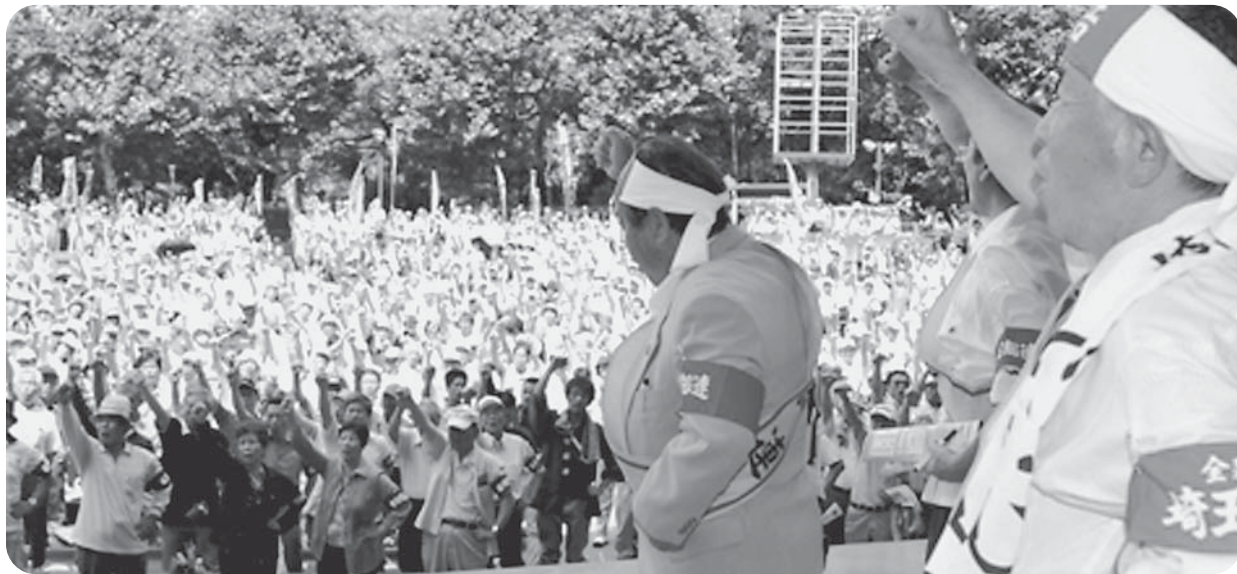
日比谷公園に集まった仲間5617人が団結ガンパロー