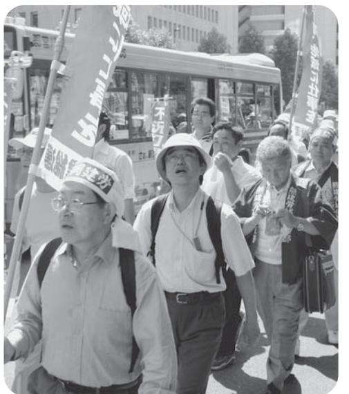
酷暑の中、都内をデモ行進

請も行いました。 集会後は、「建設国 保を守れ」「仕事をよ こせ」「アスベスト被 害者を救済しろ」と声 をあげながら東京駅ま で都内をデモ行進しま した。