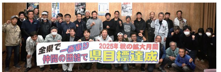
支部執行委員会で集まった役員と喜びの写真撮影

秋の県目標一番乗りの勢いで、春の月間、そして年間目標の達成と増勢めざして、更なるみなさんの新しい仲間の紹介と周りへの声掛けをお願いします。