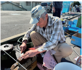
包丁研ぎも大忙し