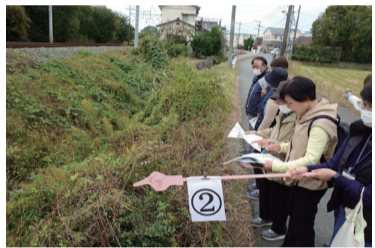
水路が未整備で水はけが悪い

街角ウオッチング実行委員会では、10月11日に市担当課を招き学習会を開催。その中で、水害の対策工事が進められている歴木地域と田隈手鎌地域の説明を受け、現地の視察を11月12日に地域住民を交えて行いました。