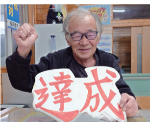
高田分会も執念で達成

また、本月中旬は、各分会での出陣式や毎週木曜日の仲間訪問、1日と15日のおはよう宣伝、本部宣伝カーも土日含めた5日間の運行、11月20日は日中の未加入事業所訪問を展開