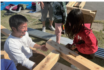
初めてのハンマーに苦戦