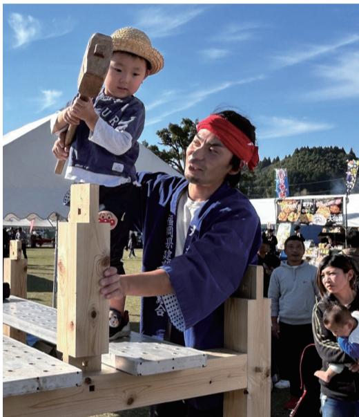
大工体験に子どもたちも大喜び