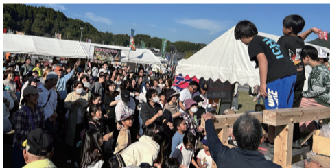
最後は投げ餅で大盛り上がり