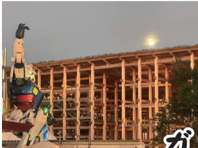
等身大のガンダムの写真の中でも宝物の1枚

自分にとって貴重な逸品や、家族にとって世界遺産と同じくらい大切なものなど紹介するコーナー。今月は歴木A分会からの紹介です。