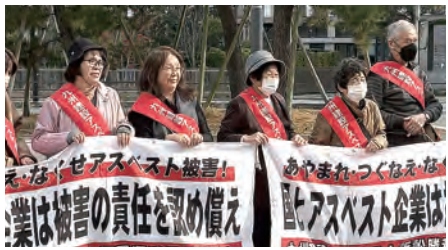
入廷前の門前集会

1月15日(木)は「九州建設アスベスト3 陣裁判支援」に参加のため事務所を閉めてい ます。ご協力をおねがいします。