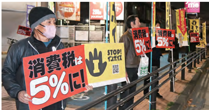
東新町交差点でスタンディングとマイク宣伝

が必要になります。税金をめぐる情勢を知り、納税者の権利も学習しておかなければ、いざという時に調査官にいいようにされてしまいます。23日の更新説明会後にも実施します。