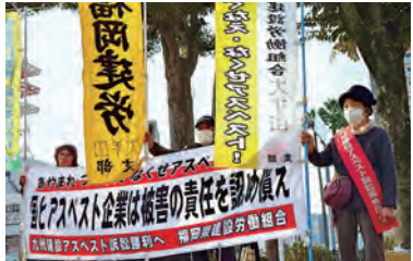
裁判所へ向かう前に街頭宣伝

前回の期日で、和解 解決をめざすと裁判長 から提案がありました が、今回も和解に向 けた聞き取りを行って いきたいとの発言もあ りました。全国の同種 の裁