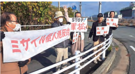
ミサイル艦の三池港入港に抗議行動

高市首相は、防衛費GDP比2%へ引き上げる方針を前倒しで進めています。11兆円にものぼる大きな金額は、私たちの暮らしに置き換えれば、教育や医療、介護、子育て支援、災害対策など、どれだけの多くのことがで