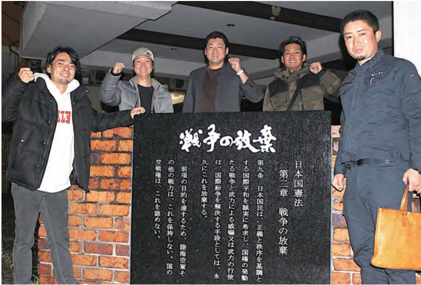
平和は俺たちで守ろうと九条の碑の前で青年部

種で、乗り出して3年未満で飛び出し車の追突事故に合い、泣く泣く一度は別れました。しかしまだ同じのに乗りたい思いが強かったの、年式は違えど同じ車種に乗り継いでいます。子育てや仕事でなかなか乗る機会が少ないのですが、九州圏内はあちこち走ってます。