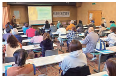
学習会で税の情勢を確認

所得税にて大幅な改正 所得税の103万円の壁について160万円に引き上げられましたが、その財源に消費税を引き上げることも懸念されます。少なくとも基礎控除の引き上げは必要ですが、まずは不公平税制を正し