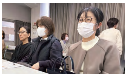
講演で学ぶ女性の会

不登校・ひきこもり家族の会の話をきいて、知人の子供が不登校になった話は多々あります。 すぐ解決できるものじゃないので、周りの方への相談や施設を活用した取り組みを利用すべきだと思いました。さっそく教えてあげたいと思いました。