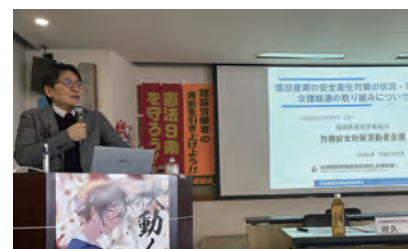
法改正などについて学習

支部でも、その都度、学習会などを企画していきますので、自身や従業員の安全を守るため、必ず参加ください。（西原通信員）