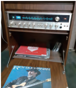
レコードが聞ける音響

自分にとって貴重な逸品や、家族にとって世界遺産と同じくらい大切なものなど紹介するコーナー。今月は田隈分会からの紹介です。