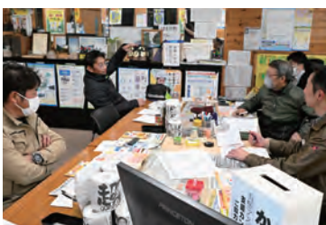
現場の状況を意見交換

定例のアスベスト宣伝は1月5日に。また、1月15日は3陣12回目期日が行われるにあたり大牟田駅前で宣伝を実施しました。これ以上の被害をひろげない