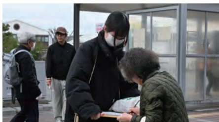
署名の協力も呼びかけ

みがあり、これだけ聞かない音も。お酒を飲みながらゆっくり音楽に浸る時間はとても幸せです。 いろいろガタは来ていますが、なるべく大切に扱って今後もレコードで音楽を聴いていきます。