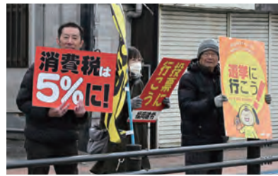
選挙に行こうをアピール

消費税の減税や廃止をもとめる国民の大きな声におされ、これまでに「消費税は下げられない」と言っていた自民党までもが食料品の消費税を時限的にゼロにする案を口にせざる